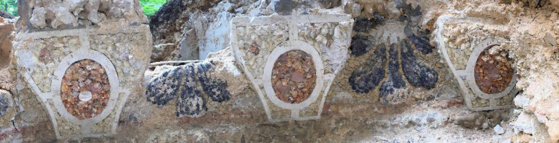
Décor de la grotte de Noisy, fouilles 2017