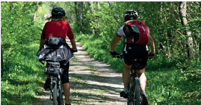
Développer les mobilités douces

Ainsi, nous avons entrepris récemment la concertation nécessaire sur l' aménagement du Manoir situé à proximité de la Mairie qui comprendra 35 logements sociaux sur un site ouvert aux Baillacois avec une approche architecturale fidèle à l'existant. Projet qui nécessitera à court terme un réaménagement de la voirie et du stationnement dans ce quartier.