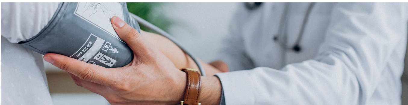
Appréhender l'offre et la couverture médicale

L'implantation de nouveaux professionnels de santé sur notre territoire est un enjeu qui nous préoccupe d'autant plus que plusieurs médecins généralistes ont récemment pris leur retraite. Dans ce contexte, nous restons en étroite concertation avec les élus des communes voisines et le corps médical local avec l'intention de créer plus de liens avec le secteur hospitalier et la faculté de médecine de Saint Quentin en Yvelines.