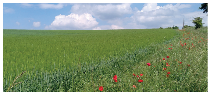
Préserver nos espaces naturels et agricoles

Quant au Plan Climat porté par Versailles Grand Parc, il fera dès février l'objet d'un diagnostic sur la base de réunions publiques et d'ateliers thématiques.