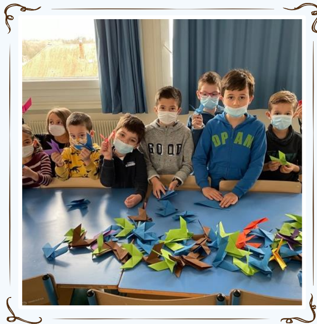
Février 2020 Des colombes réalisées au profit de la lutte contre le cancer