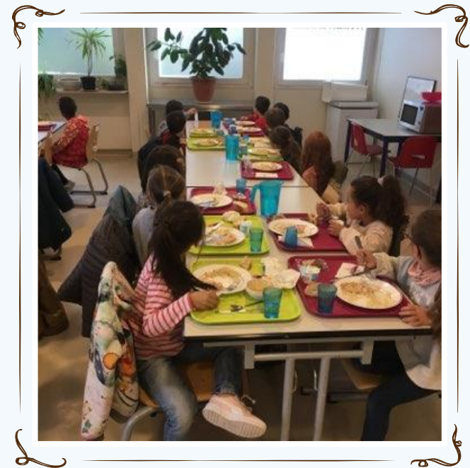
La cantine en élémentaire