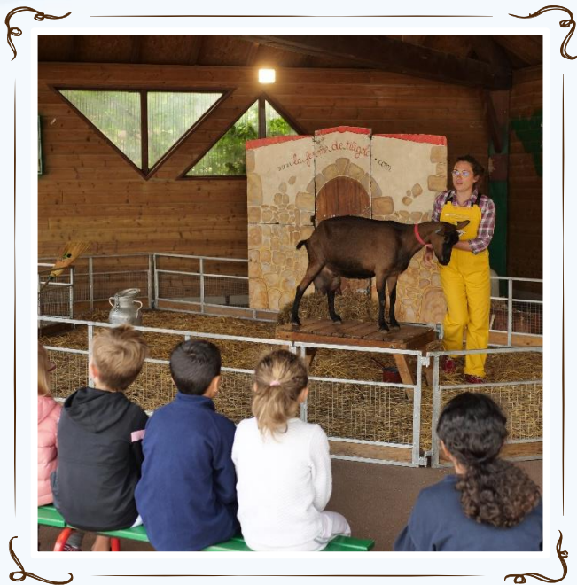
Mai 2022 La ferme Tiligolo